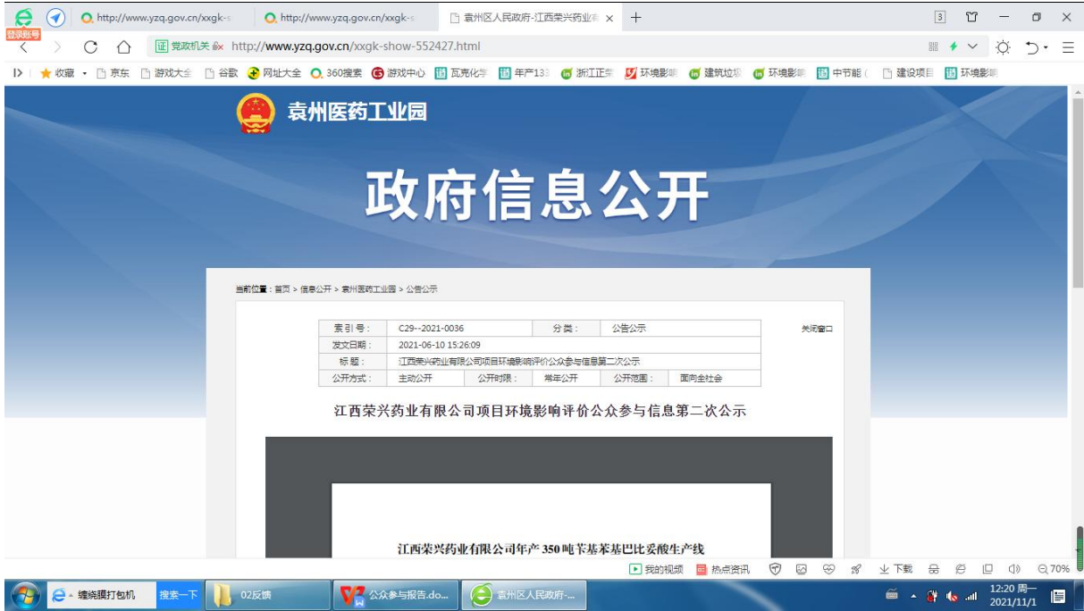
图 2.2-1 第二次公众参与网站公告截图