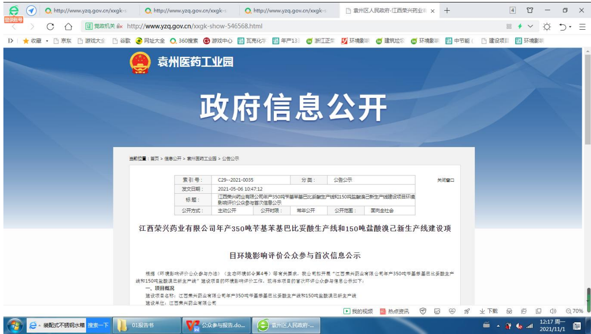
图 2.1-1 第一次公众参与公示照片